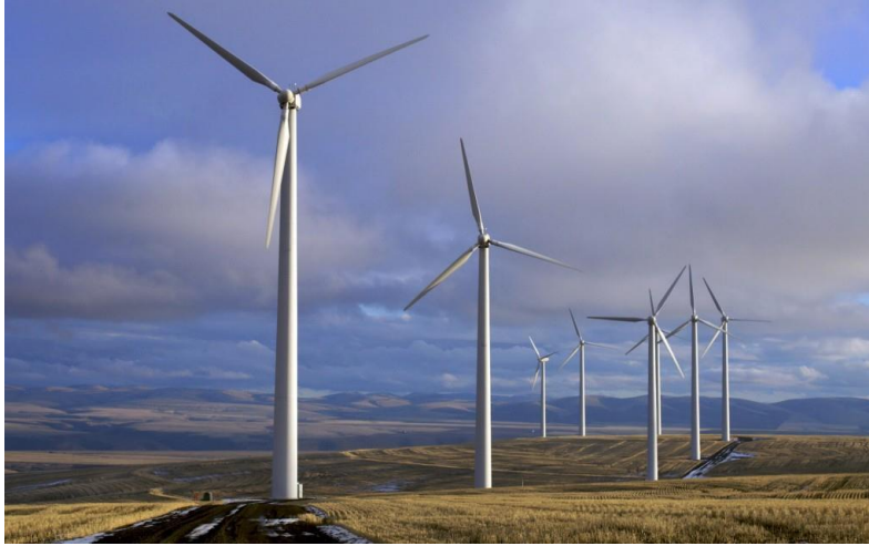
شکل ۳- نیروگاه بادی