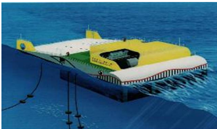
شکل ۴- انرژی اقیانوس

حدود ۲ درصد و کشورهای در حال توسعه حدود یک درصد از برق آبی جهان را تولید می‌کنند. با این همه تا کنون تنها از ۱۸ درصد پتانسیل قابل بهره‌برداری برق آبی جهان استفاده شده است. پیش بینی می‌شود در دو دهه اول قرن بیست و یکم، میزان رشد تولید الکتریسیته از منابع آبی ۲۵ درصد در سال باشد. با این وصف انرژی برق آبی هم چنان بزرگترین منبع انرژی تجدیدپذیر باقی خواهد ماند و تنها عوامل اقتصادی و زیست محیطی می‌توانند پتانسیل واقعی این منبع را محدود کنند. دو سوم منابع برق آبی در کشور چین قرار دارد. طرح‌های برق آبی ممکن است خسارات زیست محیطی به همراه داشته باشد. مثلا ساخت جاده برای دسترسی به نیروگاه، نصب پایه‌های انتقال نیروی برق و سرانجام ساخت سازه خود سد ممکن است زیستگاه طبیعی را مورد تخریب قرار دهد. انحراف مسیر رودخانه هنگام ساختن سد ممکن است صدماتی از قبیل مرگ و میر ماهی به وجود آورد. به طور کلی در مورد نیروگاه‌های آبی کوچک صدمات زیست محیطی در مقایسه با منافع آنها و تولید الکتریسیته قابل توجه نیستند.