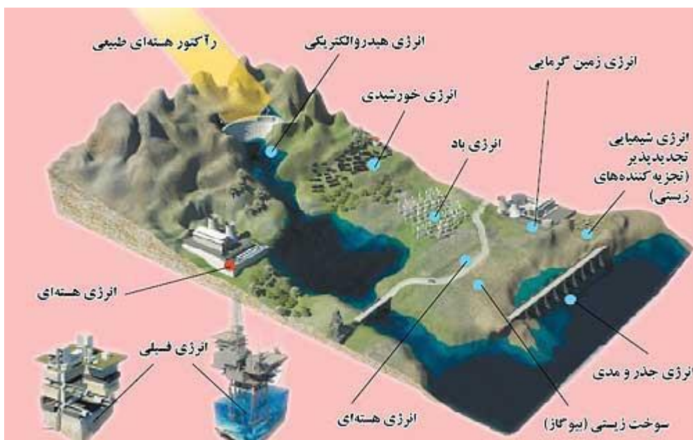
شکل-۱ شمای کاربردی انرژی‌های تجدیدپذیر

در به کارگیری انرژی‌های تجدیدپذیر دو رویکرد عمده وجود دارد. ابتدا روش ترکیبی است که در آن همه انواع این انرژی‌ها به برق تبدیل می‌شود. و در رویکرد دوم با تجهیزات ویژه، این انرژی‌ها را بی‌واسطه در گرمایش، سرمایش و محورهای چرخان مکانیکی به کار می‌برند. حال باهم به بررسی انواع این انرژی‌ها می‌پردازیم.