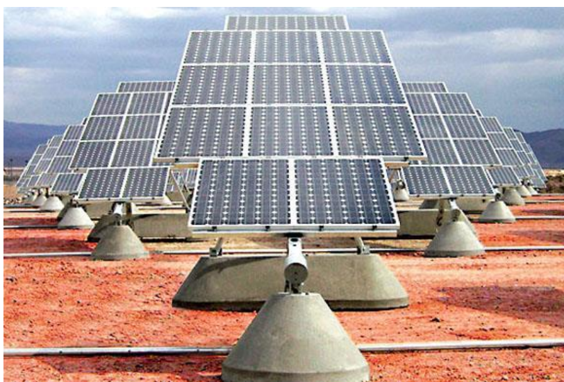
شکل ۲- نیروگاه خورشیدی

بنابراین با تحقیقاتی که در سراسر دنیا در حال انجام است، به زودی استفاده و بهره برداری از نیروگاه های بزرگ خورشیدی همه گیر خواهد شد.